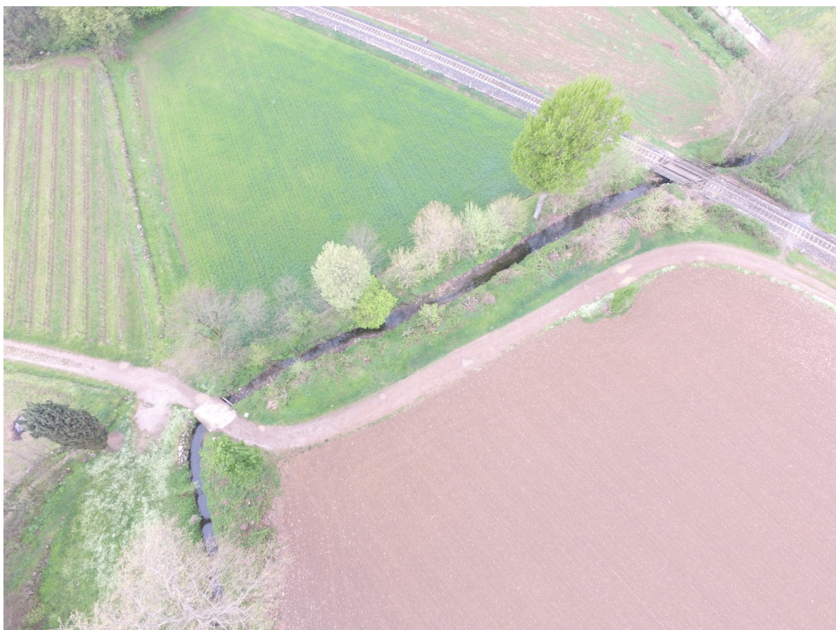
Foto 6 - immagine del torrente ripresa da drone – attraversamento ferroviario e stradale