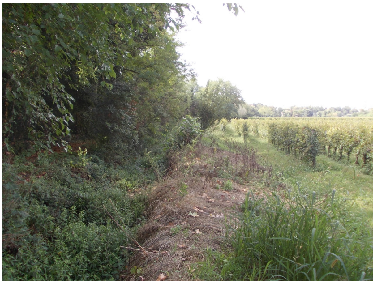
Foto 14 vista dello stato di manutenzione del torrente