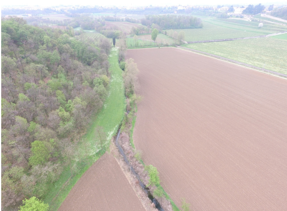
Foto 4 - immagine del torrente ripresa da drone