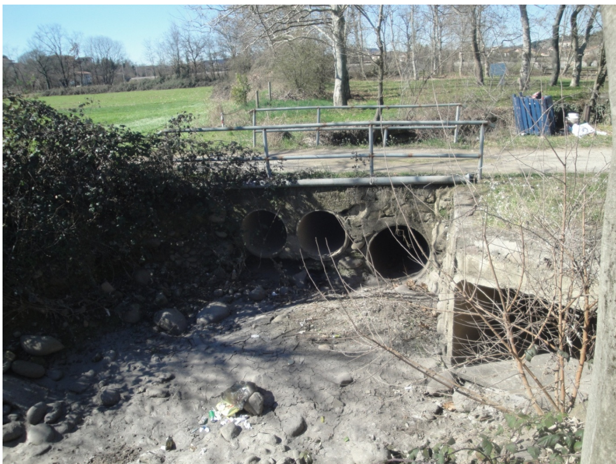
Foto 8 – attraversamento stradale su torrente e scarico fognario nel torrente