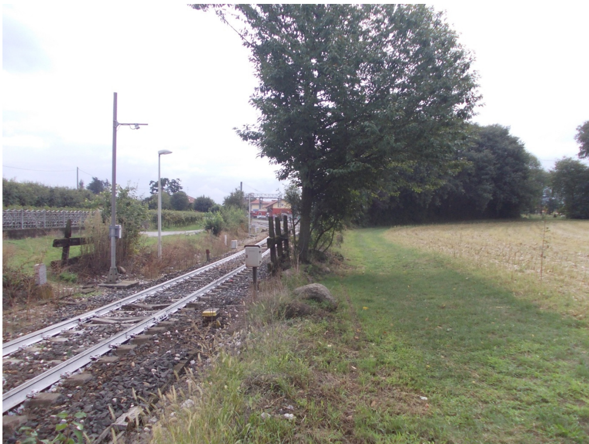
Foto 13 - vista dell'area di allagamento nei pressi della ferrovia e della stazione di Bornato-Calino