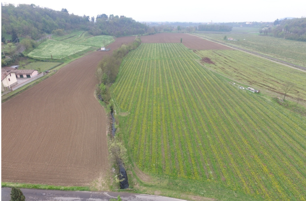
Foto 3 - immagine del torrente ripresa da drone