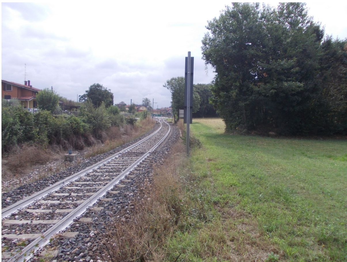
Foto 11 – vista dell'area di allagamento nei pressi della ferrovia e del centro abitato