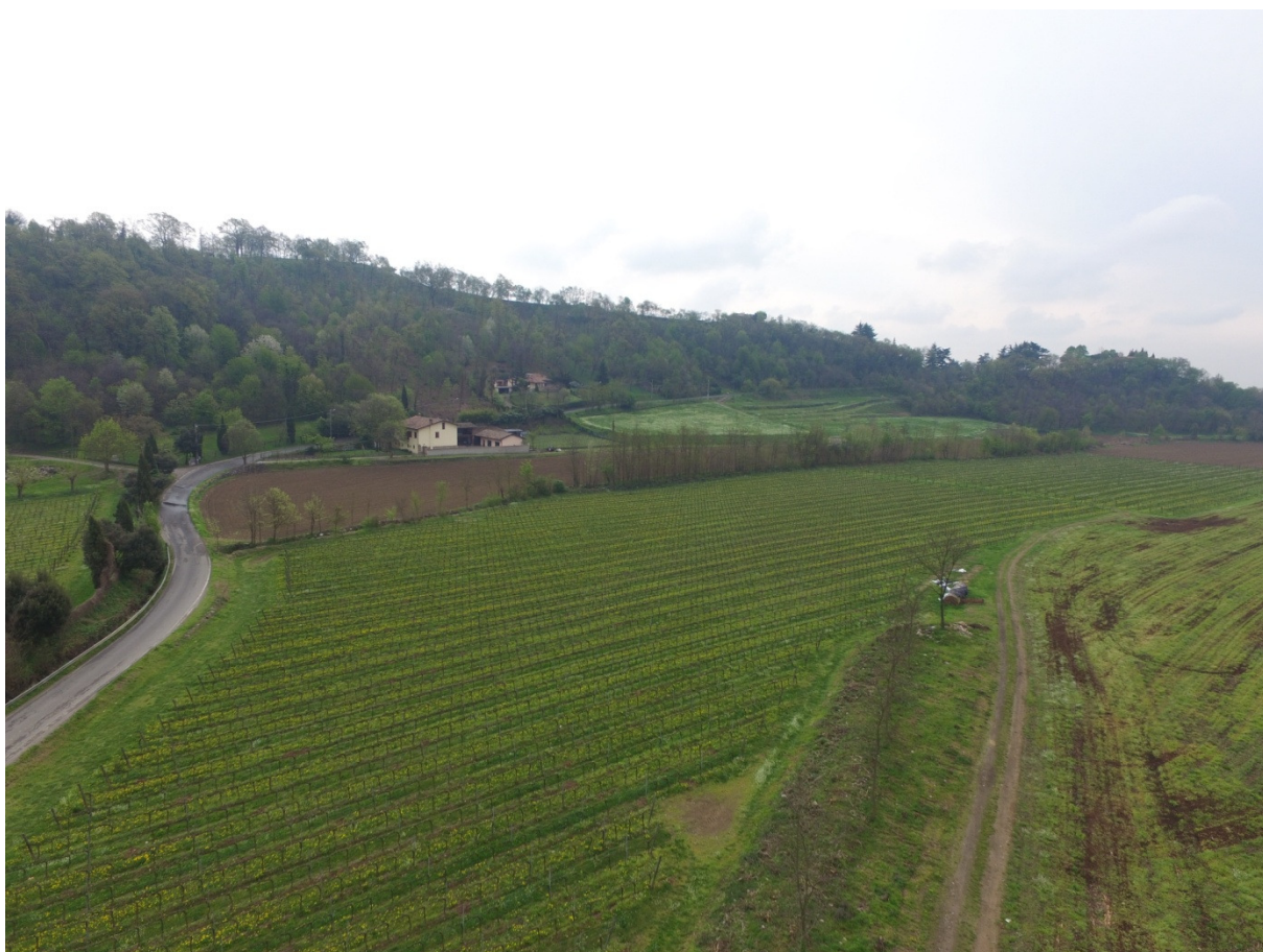
Foto 2 - immagine del torrente ripresa da drone