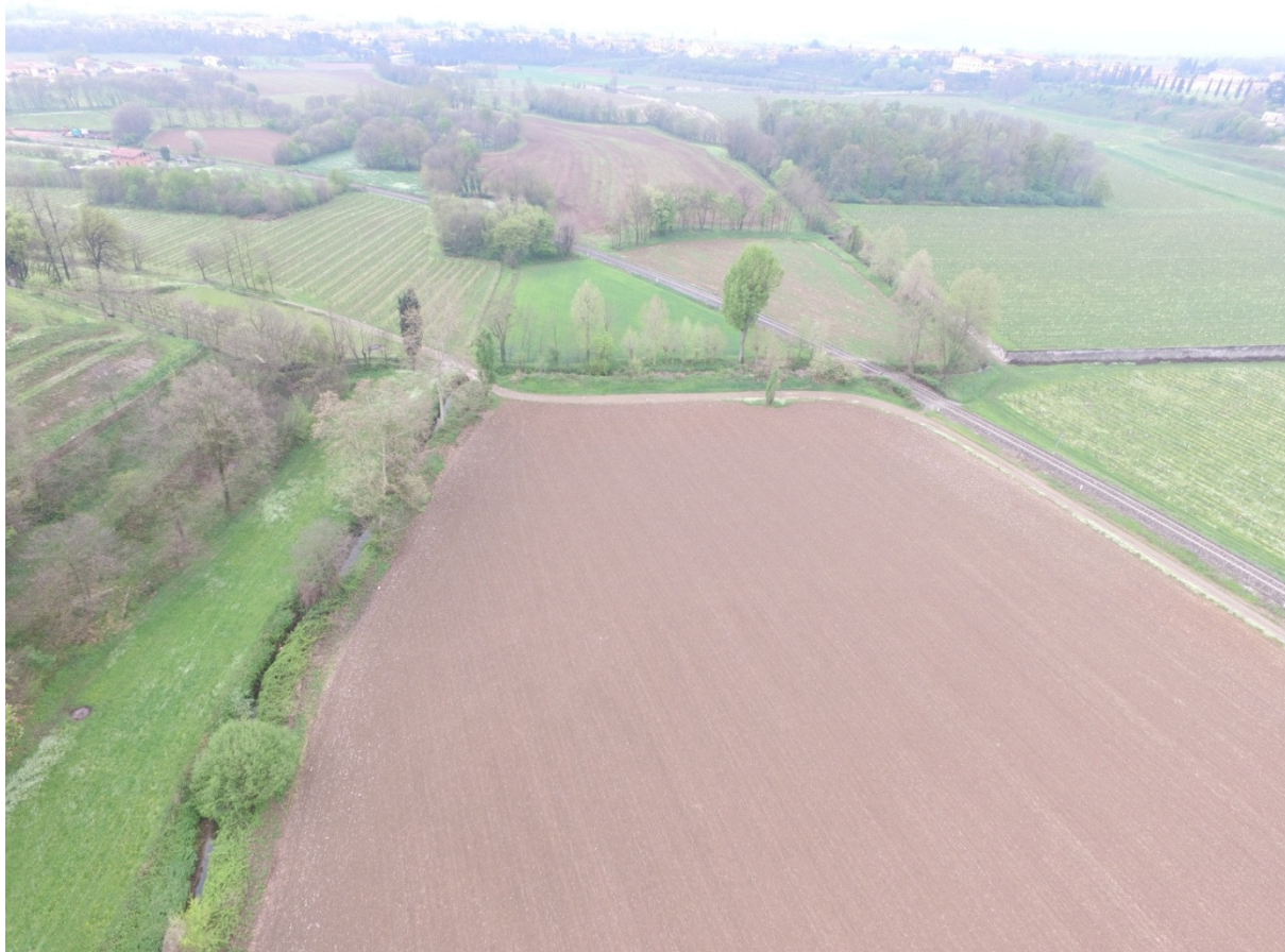
Foto 5 - immagine del torrente ripresa da drone