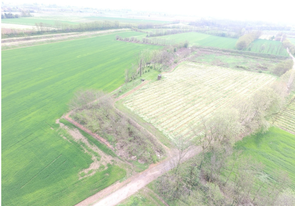
Foto 7 - immagine del torrente ripresa da drone