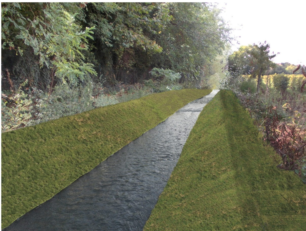
Fotosimulazione dopo la sistemazione del torrente in prossimità dell'attraversamento di via Roma