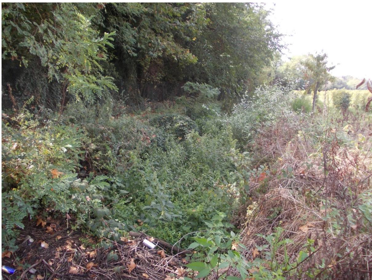
Sopra immagine del torrente in prossimità dell'attraversamento di via Roma