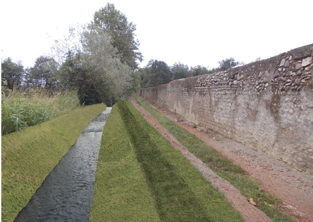
Fotosimulazione dopo la sistemazione del torrente in prossimità della proprietà Maggi