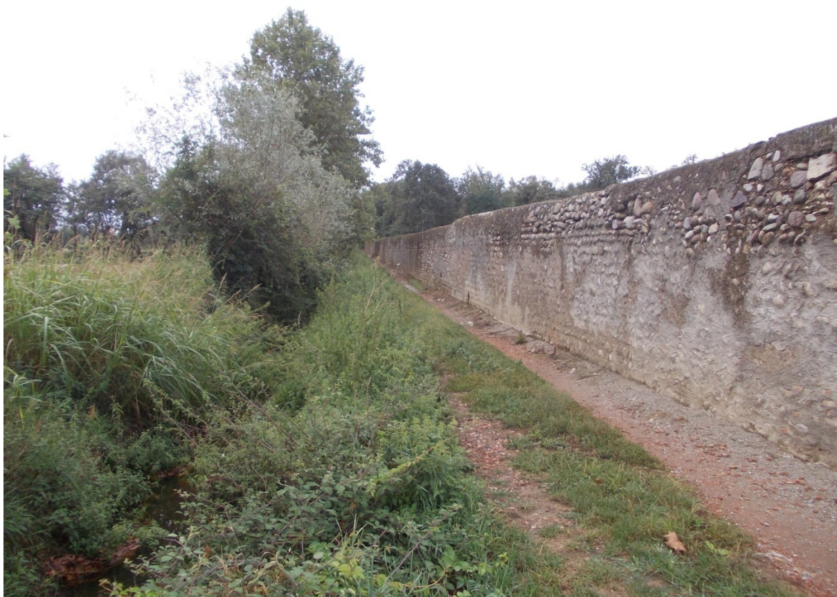
Sopra immagine del torrente in prossimità della proprietà Maggi